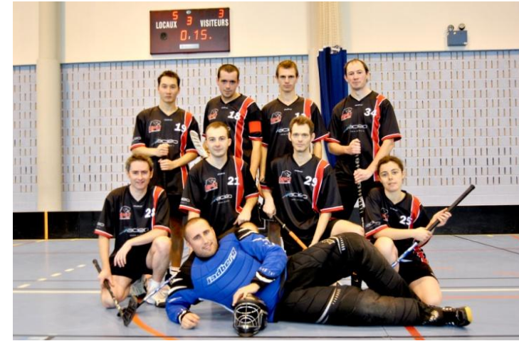
Equipe victorieuse contre Amiens (5-3), en championnat 2011-2012

Le club tient également à organiser au moins deux manifestations lors de la saison 2012-2013. Un week-end de championnat se tiendra à Rennes les 20 et 21 octobre 2012. Et après la belle réussite de la première édition, le Tournoi des Panthères prendra place lors des vacances de février.