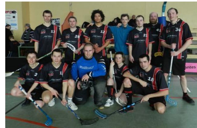
L'équipe du RFC engagée au Tournoi des Panthères 2012

Le RFC compte rayonner sur tout l'ensemble du bassin rennais, merveilleux vivier de joueurs avec ses 30 000 étudiants .