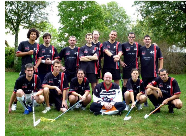
Les panthères à l'Open de Nantes 2012

Les panthères du Rennes Floorball Club ont été aperçues pour la première fois lors du 3 e Open de Nantes, en 2010 . Depuis, elles ont à leur actif une belle quatrième place au tournoi international de la Francophonie ainsi qu'une deuxième place au 4 e Open de Nantes . La première édition du Tournoi des Panthères a regroupé, les 11 et 12 février 2012, l'ensemble des équipes du Grand Ouest. Devant ses nombreux supporters, le club a fini 3 e .